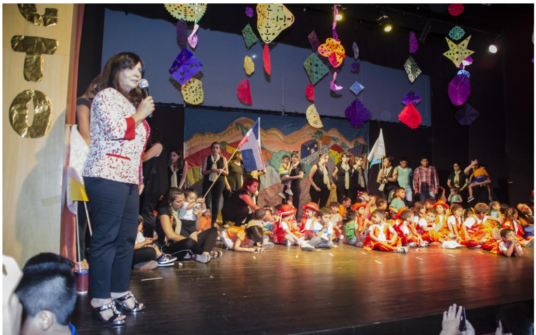
Imagen del acto de fin de año: